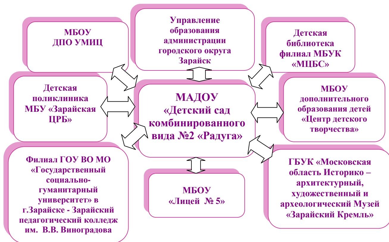
Схема взаимодействия с социальными партнерами

Социальным партнером является и МБОУ ДОД ЦДТ, воспитанники которого регулярно выступают в детском саду с концертами, что повышает эстетический уровень развития детей-дошкольников, которые впоследствии становятся воспитанниками этой школы.