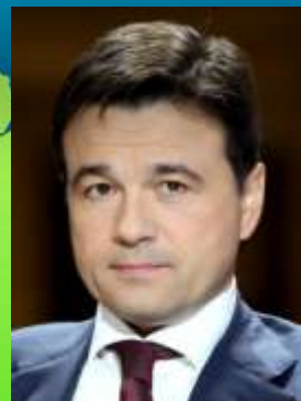
Губернатор Московской области. Воробьев А.Ю.